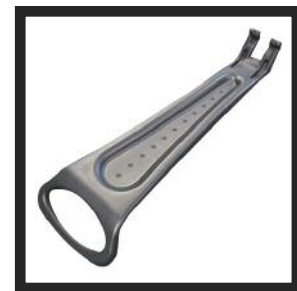
Griff als Zubehör erhältlich: H0008604

LINPAC Allibert SAS verfügt über ein Kapital von 39 335 642 Euro. Hauptsitz : 2 rue de l'égalité 92748 Nanterre Cedex Frankreich. SIREN : 785 233 339 RCS Nanterre. Im Rahmen unserer Unternehmenspolitik der laufenden Verbesserung behalten wir uns das Recht vor, die technischen Daten unserer Produkte ohne Vorankündigung zu ändern. Oktober 2009 – N. 302-A. WYATT